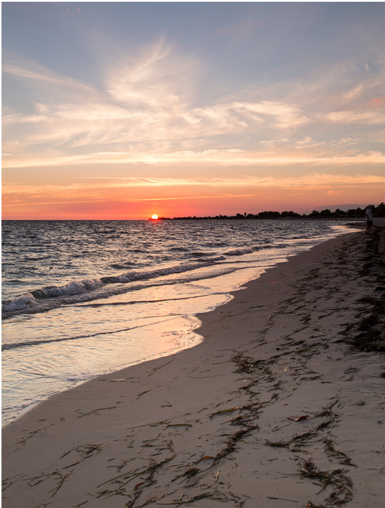
Západ slnka neďaleko Trinidadu.

Podvečer sme sa ubytovali v masívnom betónovom hoteli Ancón na polostrove vzdialenom asi desať kilometrov od mestečka