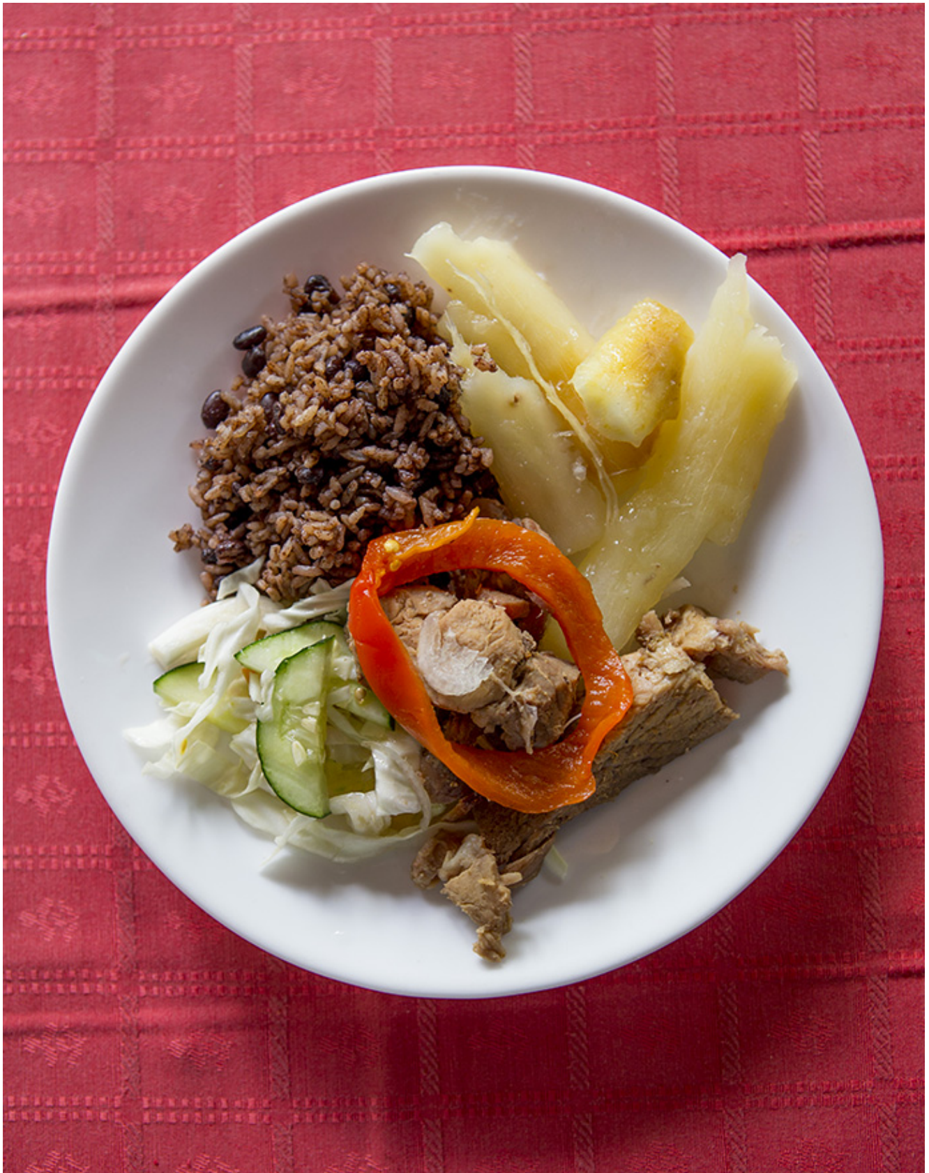
Obed v údolí Viñales. Pečené bravčové s ryžou s čiernou fazuľou a kubánskymi zemiakmi.

Západná provincia Pinar del Río je krajom piňa colady. Zastavujeme v blízkosti domu farmára, vedľa ktorého na