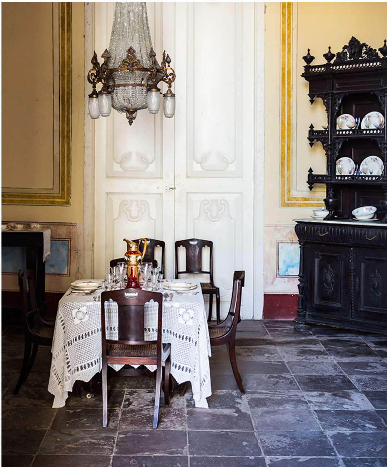
Krásna jedáleň z čias kolónie.