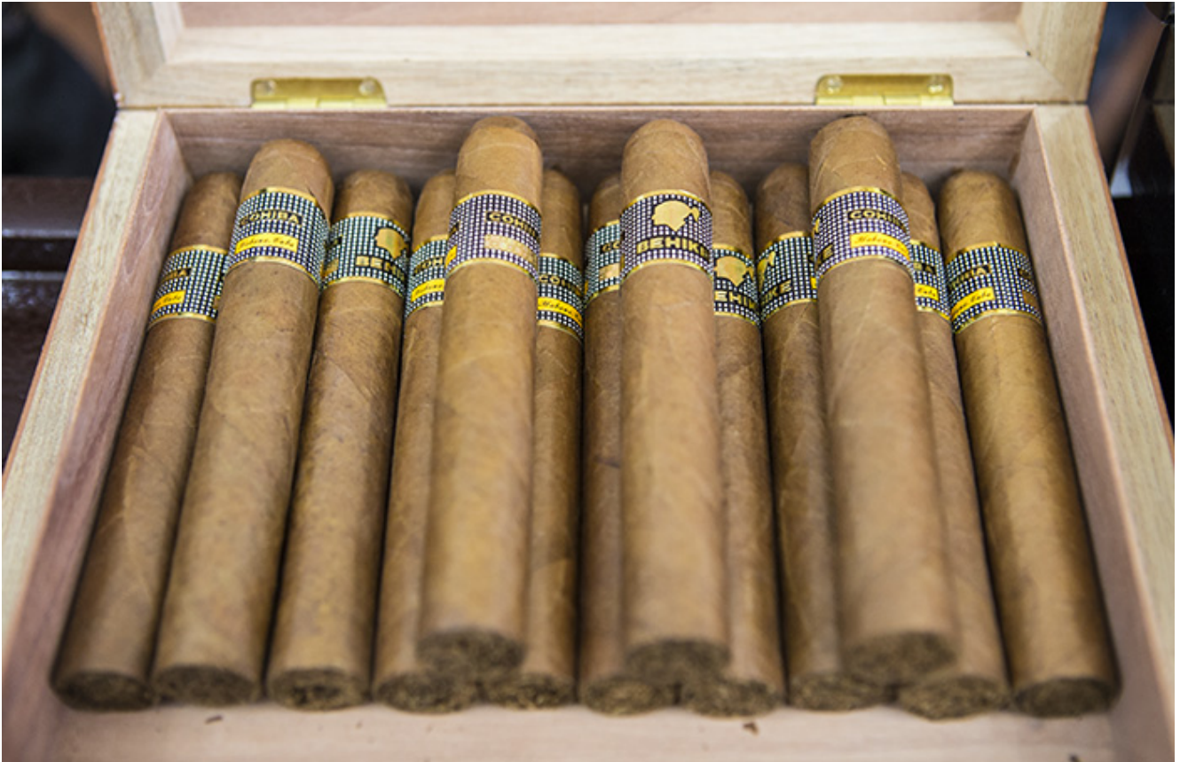
Cohiba Behike – jedny z najdrahších cigár na svete.

Zamestnancom vraj počas pracovnej doby púšťajú hudbu podľa značky, ktorú vyrábajú. Ak sa vyrábajú silné Cohiby, púšťajú im Fidelove politické prejavy. Ak vyrábajú Romeo y Julieta, počúvajú ľúbostnú poéziu. V čase mojej návštevy vyrábali Vegueros – značku cigár pre domáci trh. Je to vychytávka a je takmer nemožné kúpiť ju. Na konci miestnosti sa nachádza kontrola ťahu – prístroj, do ktorého vložia úplne každú cigaru a kontrolujú, aká je priepustnosť vzduchu. Ideál je 40 milibarov.